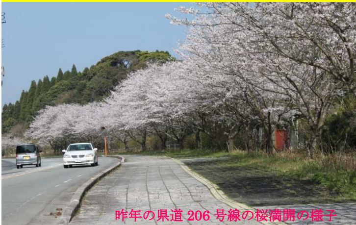
昨年の県道206号線の桜満開の様子

春一番 立春2月4日から春分3月21日までの間に初めて吹く南よりの強風。桜前線の桜の開花が待ち遠しい季節となりました。