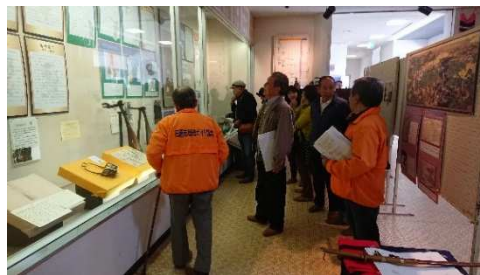
吹上歴史資料室をご案内中