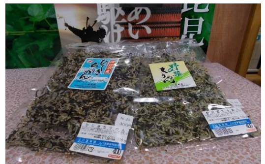
ひじきちりめん・野菜ちりめん