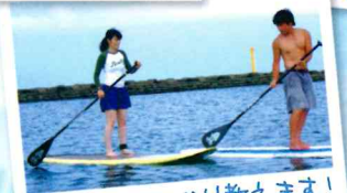
漕ぎ方もしっかり教えます!