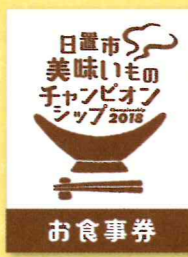
お食事券は、イメージです。