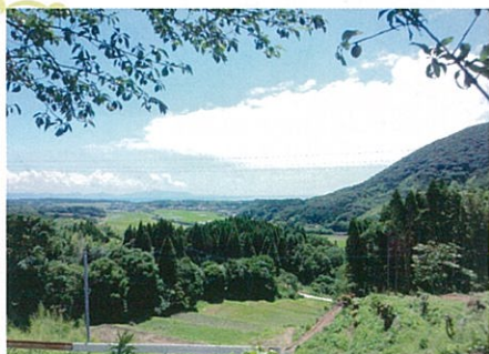
バンガローから眺める東シナ海と棚田